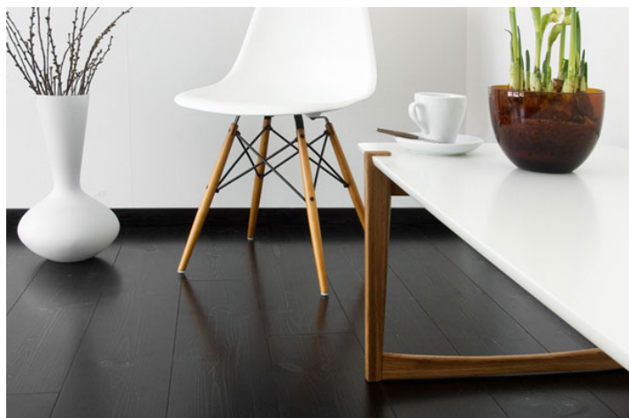
Furu Trend Svart パイン・ブラック・ラッカー塗装

塗装は、素材そのものの質感が感じられるオイル仕上げと、表面に傷が付きにくく、手入れのいらないラッカー仕上げとがあります。そして、オイルのような質感を残しつつ、ラッカーに近い強さを合わせもったハードワックスオイル仕上げです。色はナチュラルの他に、木目が見えるホワイト、ブラウン、グレー&ブラックと、インテリアに合わせてお選びできます。