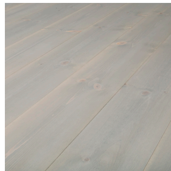
Furu Trend Grå パイン・グレー ラッカー塗装