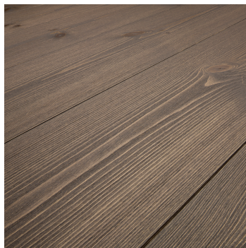
Furu Patina Brun パイン・ブラウン(凹凸表面) ハードワックスオイル塗装